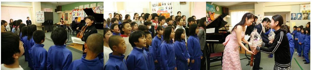
最後はふれあいトリオの演奏に合わせて、みんなで「君をのせて」を大合唱！