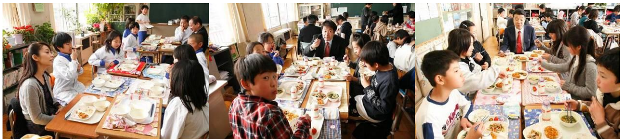
楽しい給食の時間は、みんな元気いっぱい！会話も楽しくとっても美味しく頂きました！