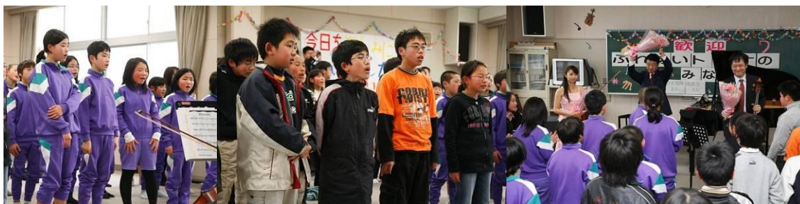
ふれあいトリオの演奏と共に「世界がひとつになるまで」を合唱。あっという間に時間が過ぎてしまいました！