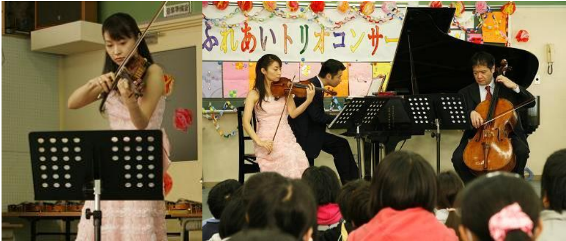
待ちに待った「ふれあいトリオ」のコンサートが始まりました！

10:45～11:55 山梨県南アルプス市立 落合小学校 音楽室(3階) 4・5年生 65名対象