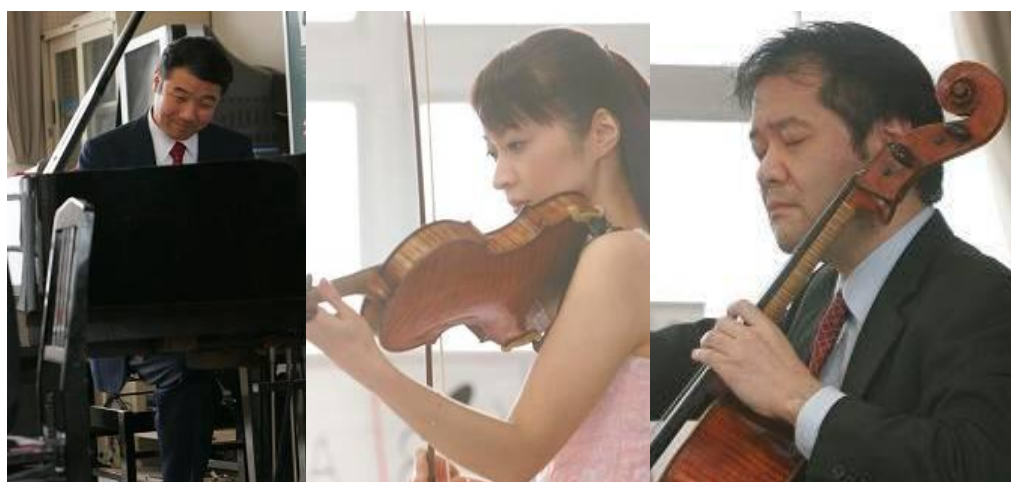
ふれあいトリオの熱演が音楽室に満ちていきます。