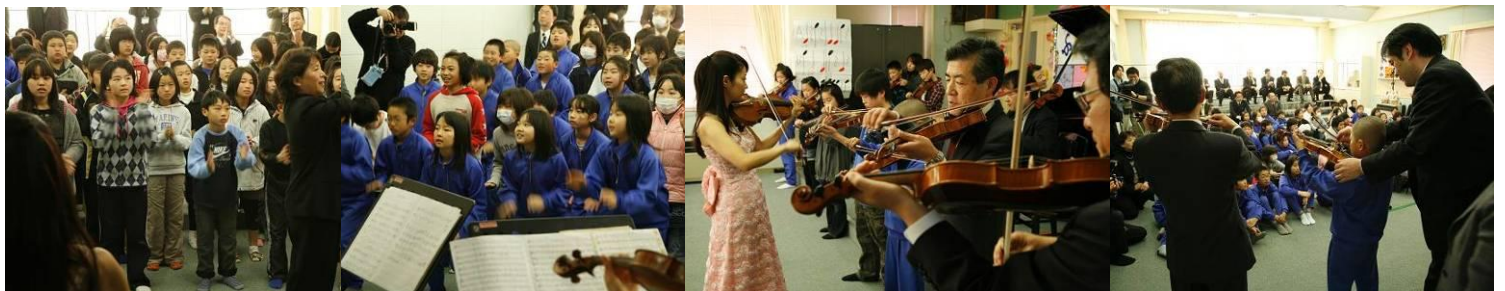
ボディーパーカッションは音楽に合わせて手や足を使って皆と一緒に盛り上がります！