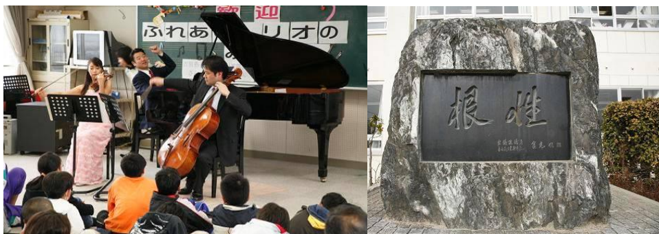
今日も息の合った演奏で迫力満点！

14:30~15:40 山梨県南アルプス市立 白根東小学校 音楽室(3階) 5年生 59名対象